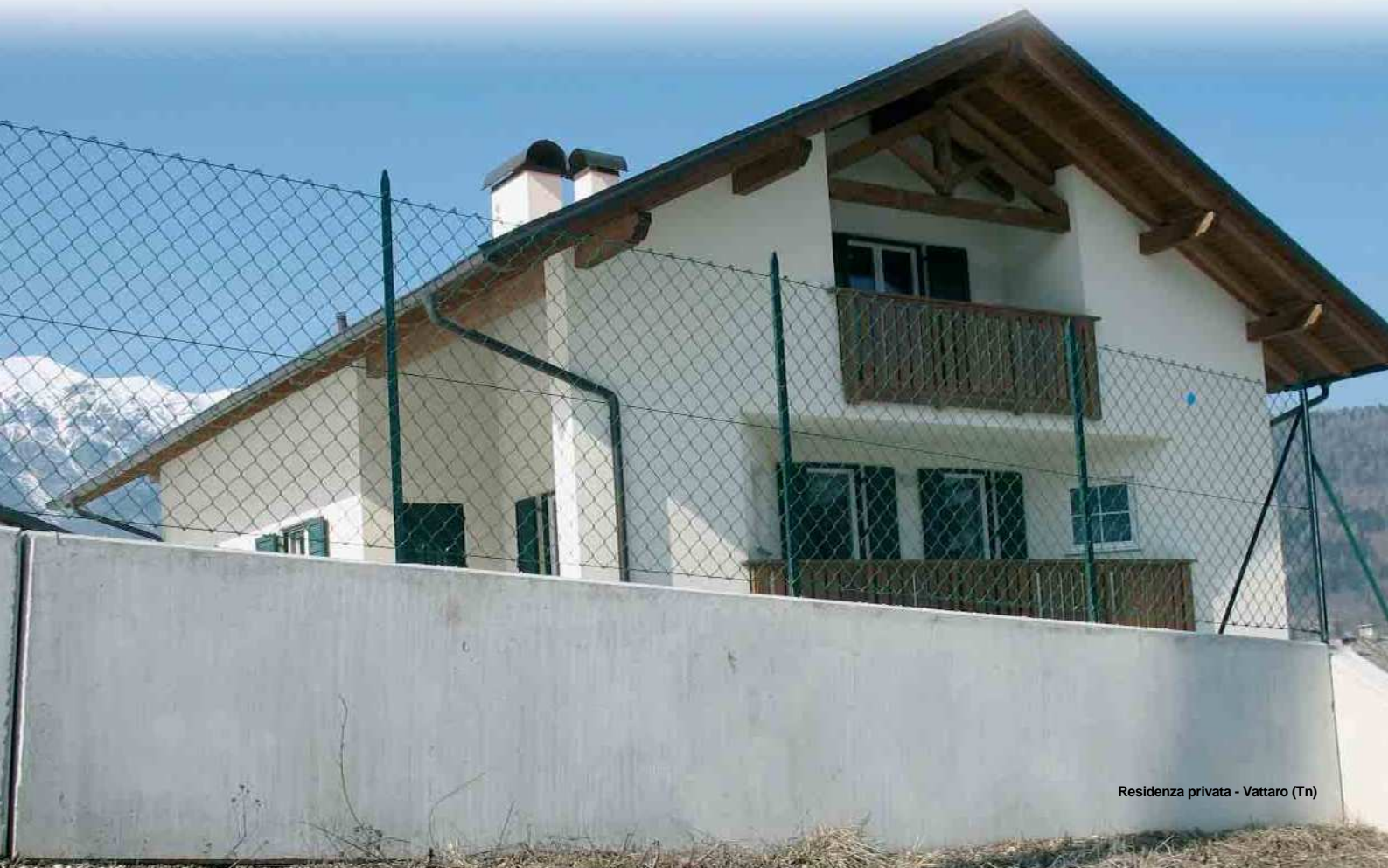
Residenza privata - Vattaro (Tn)