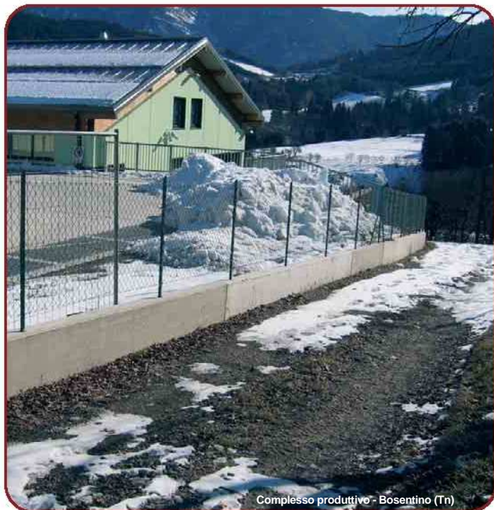
Complesso produttivo - Bosentino (Tn)