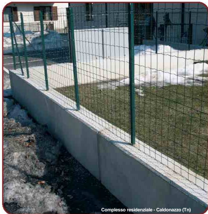
Complesso residenziale - Caldonazzo (Tn)

38056 Levico Terme (Tn) - Viale Venezia, 98 • tel. 0461 701717 - fax 0461 707721 e-mail: info@edilcomm.com • tecno@edilcomm.com • www.edilcomm.com